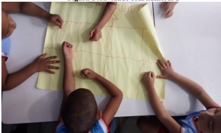
Figura 1 Atividade com numeral 1