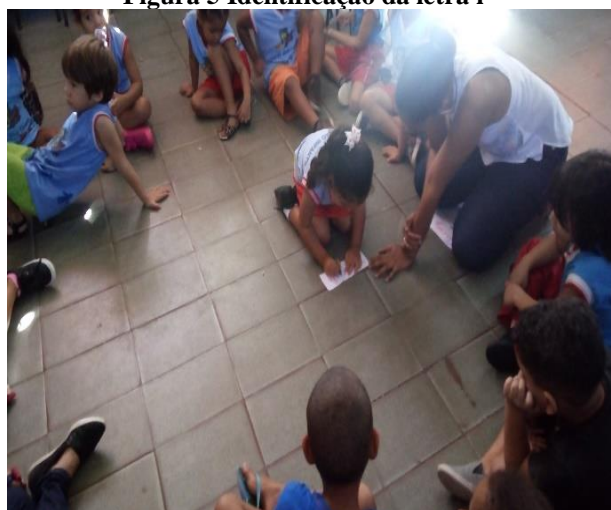
Figura 5 Identificação da letra i

Em uma outra atividade ainda sobre a letra i (Figura 5) escreveu-se em pedaços de papel o nome das crianças. Na rodinha, as crianças foram chamadas para pintar a letra i do nome do coleguinha. Já foi possível perceber que algumas crianças já sabiam que a letra i era a que tinha um pontinho encima, o que deu a certeza de que as mesmas tinham adquirido o conhecimento.