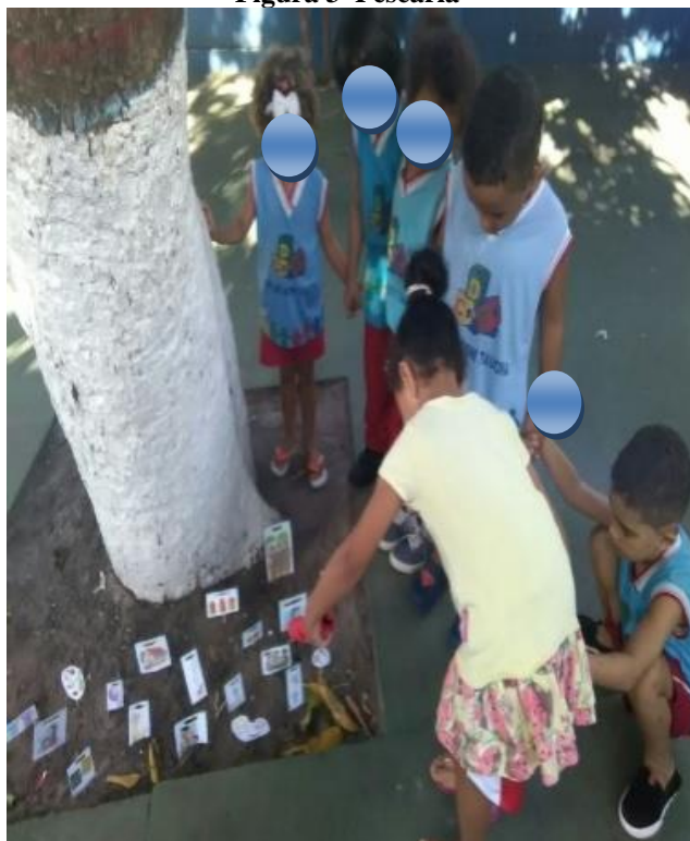
Figura 3 Pescaria