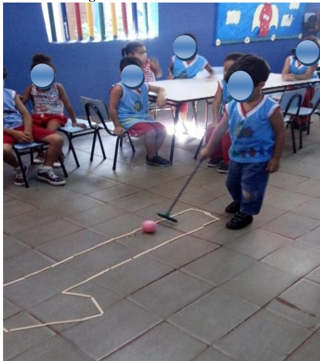
Figura 2 Percorrendo o numeral 1

Com palitos de picolé, foi feito o numeral 1 e eles tinham que percorre-lo empurrando uma bolinha com um rodinho conforme mostra a imagem abaixo.