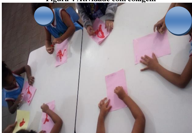
Figura 4 Atividade com colagem

Apesar de ter sido decidido não utilizar atividade de folha durante o período de regência, a coordenadora exigiu que trabalhasse pois precisava organizar o material para entregar aos pais no final do semestre. Decidiu-se então fazer as atividades mais dinâmica, de forma que as crianças não sentissem tanto o peso da atividade. Foi realizada então atividade com colagem, como mostra a figura 4.